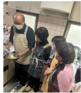
【20】ふわふわ幸せ♡シフォンケーキ