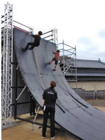
【24】国内初！オブスタクル！ スポーツを体験しよう！