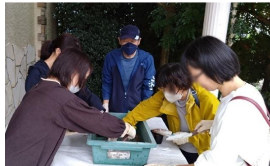
【25】エディブルフラワーとは!! 植えから作ってみよう