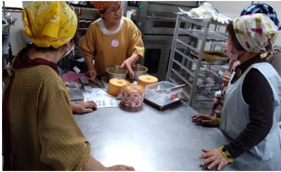
【15】あなたにもできる！はじめての米粉シフォンケーキ作り！