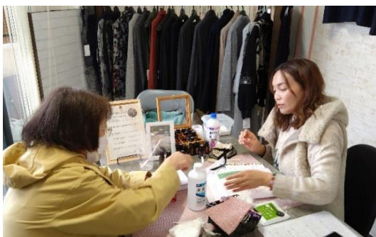
【28】アロマサシェを作りながら 洋服についてお話ししましょう