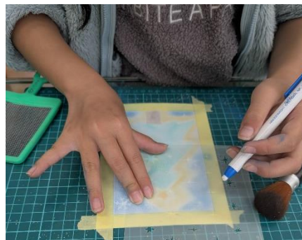
【29】パステルアートで作る メッセージカード 🌈